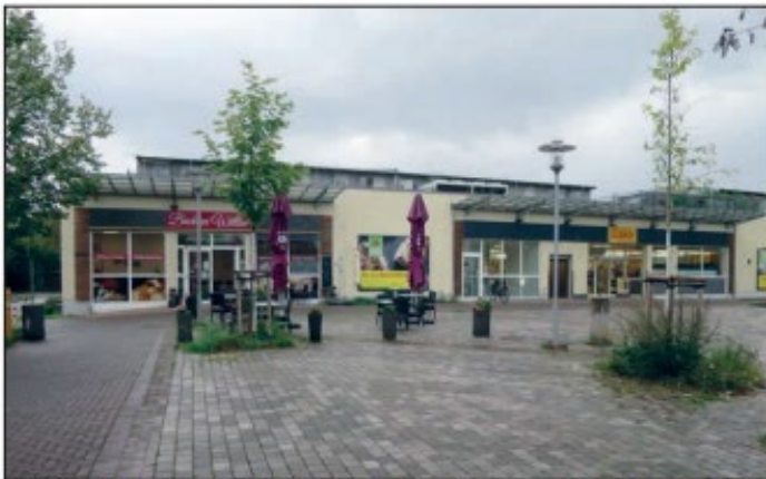
Viel Platz auf dem Hannes-Esser-Platz in Einbringungen, aber zu wenig belebt. Anwohner wollen das jetzt ändern.

Eine Gruppe von Anwohnern am Hannes-Esser-Platz in Wittlaer-Einbringungen, sowohl Alteingesessene als auch neu Hinzugekommene, hat sich vorgenommen, den etwas trostlos wirkenden Platz aufzuwerten und zu beleben. Eigeninitiative von Anwohnern und Bürgern steht im Vordergrund, aber es hat sich auch schon eine ganze Reihe von Institutionen zur Unterstützung gefunden. Das ist zum Beispiel „PlatzGrün“ vom Verein Pro Düsseldorf. Auch die Abstimmungen und Unterstützungen des Garten-, Friedhofs- und Forstamtes und des Amtes für Verkehrsmanagement sind im Gange. Die Geneh-